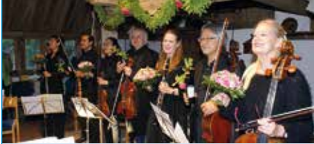
Klassikkonzert im Hallenhaus