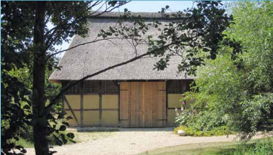
Durchfahrtscheune aus Freetz.

für ein Museumsdorf sein, wobei überhaupt noch nicht klar war, welche weiteren Gebäude noch errichtet werden und woher sie stammen könnten.