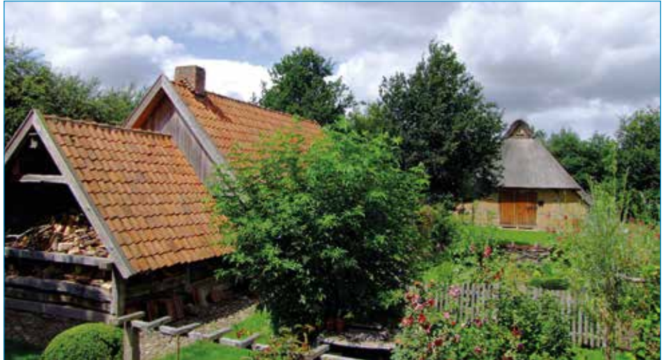
Backhaus und Schafstall um den Bauergarten.